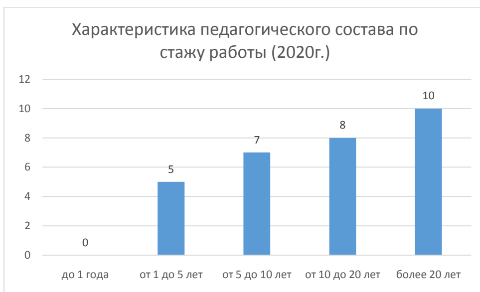
Схема 2. Характеристика педагогического состава по стажу работы